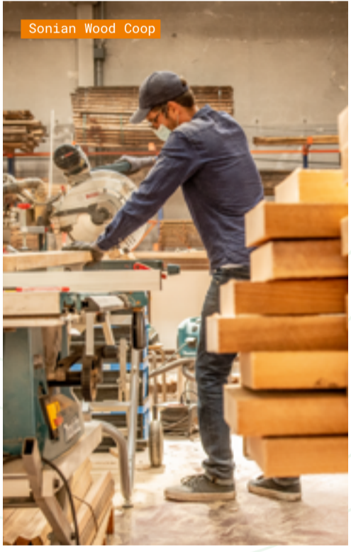
Sonian Wood Coop

Le Champignon de Bruxelles Le Champignon de Bruxelles gebruikt bostel, een bijproduct van bierbrouwerijen, om champignons te kweken in de kelders van Kuregem, in het centrum van Brussel. lechampignondebruxelles.be Urbike Urbike is een coöperatieve voor fiets-logistiek die 4 complementaire diensten aanbiedt om de levenskwaliteit in de stad te verbeteren: levering, advies, opleiding, materiaal. urbike.be