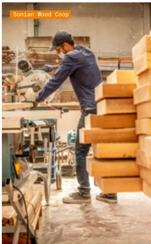
Sonian Wood Coop